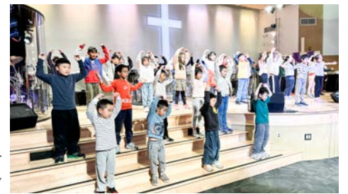
課輔班母親節獻詩 課輔班「鞋盒子」活動

我們盼望，每一位孩子都能在真理中扎根、在愛中成長；也盼望福音的種子，能藉著孩子撒進父母的心田，結出生命更新的果實。這是教會兒童事工最深的使命，也是神在社區中持續展開的宣教工作。❖