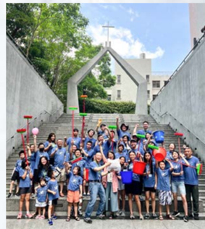
2023 年短宣隊家庭在台灣炎夏中喜樂地幫助清洗環境

事工從第一年專注於服事弱勢兒少，到第三年已服務百餘名兒童，祝福了三所育幼院的孩子，也接送坪林及周邊社區的孩童前來參與，令人動容。