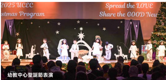
幼教中心聖誕節表演

在這些年的事奉中，教會一次又一次見證，孩子往往是父母走進教會的開始。幼教中心的聖誕節表演與結業典禮，課後輔導班在母親節主日的獻詩，讓許多未曾踏入教會的家長，因著孩子的參與而走進會堂。當他們看見孩子的成长、改變與喜樂，心中對信仰的防備也逐漸放下。