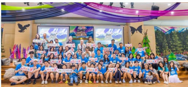
2025 年西雅圖證道堂短宣隊

西雅圖證道堂是眾多重視宣教的教會之一，近年來持續差派短宣隊前往世界各地，包括巴西、英國、墨西哥、俄國莫斯科與台灣等地。感恩的