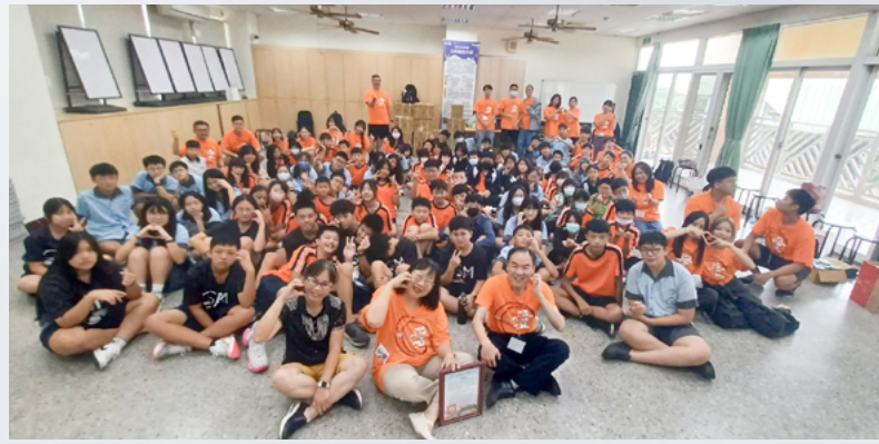
與公明國中師生合影

她回憶第三天教聖誕節課程時，帶大家唱《平安夜》，唱完後帶全班做決志禱告，幾乎整個班級的人都跟著一句一句禱告。下課後她忍不住爆哭，實在太感動了，不敢想像自己能帶領整個班級決志禱告，讓他