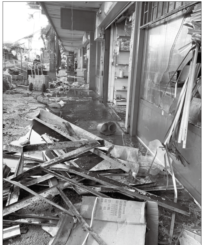
▲火災現場一片狼藉

也謝謝長期支持我們的普世豐盛生命中心及亞凱迪亞華人浸信會的牧長同工們的禱告及協助，感謝特為火災奉獻的人，讓我們在困難中不孤單，誠如聖經詩篇 34：6 所言：「我這困苦人呼求，耶和華便垂聽，救我脫離一切患難。」*