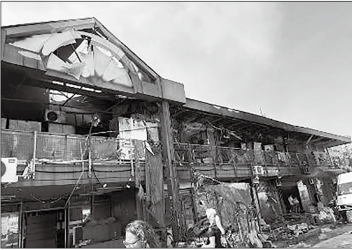
▲七十號市場大火，有 200 多間商店受損

牧者在這個時候所顧及的，不是自己是性命安危，而是想到其他弟兄姐妹們如何脫離危險。當一位弟兄身體萬分危急的情況下，感謝神仍然賜我力量可以開車載他去另一個城市的醫院，我以為我們兩個人都可以住進醫院，但是沒想到結果醫生只讓我們兩個人二選一，我也只能尊重醫生的意思，讓我弟兄住進醫院後，自己開車回家了。一路上真的不知道自己能不能開到家，只有單單仰望神了，接下去自己的性命會如何，能不能活著，也實在無法掌握，但是相信神掌管一切。感謝讚美主，奇妙的醫治和看顧，使我和每一個弟兄姐妹都在九死一生的情況下，平安度過危機活了下來，實在是神拯救了我們脫離死亡，所以常常對弟兄姐妹說，我們又欠上帝一條命。