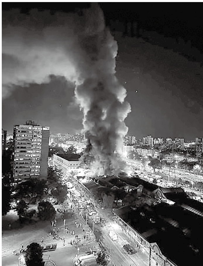
▲塞爾維亞華人聚集的七十號市場大火

我們的生命開始於母腹中，精子與卵子的結合，經過在母腹中成長由神的創造，就如詩篇 139:14 所言：「我要稱謝你，因我受造，奇妙可畏；你的作為奇妙，這是我心深知道的。」一個生命來到這個世界，整個