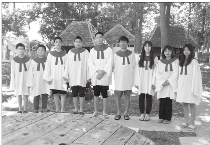
▲ 共有九位會友受洗歸入耶穌基督名下

作為傳道人難免要接觸許多弟兄姐妹，因為有些弟兄姐妹是新移民剛來到塞爾維亞，還有本地的有些弟兄姐妹也不知道去哪裡醫院檢查，對一個牧者來說，當然需要首當其衝，不可推辭的提供協助。因此我自己也被感染了，幸好非常輕度，去醫院檢查時，醫生說我有非常強的抗體不需要任何治療，只要好好休息就可以。