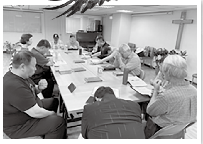
▲每週二查經晨禱會

兩年前，結束二十年的牧會，向神禱告，主啊！讓我能繼續為祢奔跑，很奇妙，神藉一次特會告訴我，會開啟全新的道路。三天後，就接到回最熟悉的故鄉服事的邀請。兩年來，藉著台北普世豐盛協會的辦公室，營造一個平台，能與眾教會及機構連結，每主日也到不同的教會見證分享，心中充滿了喜樂。特別感恩的是，三個月前，在台北辦公室成立「台北警光團契」，目前群組裡有五十多位，幾乎都是現職的基督徒警官，除了每週一次的查經禱告生命建造；每個月