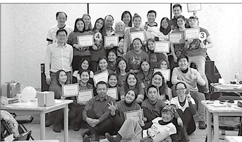
▲ TWTS 領袖課程第一屆畢業生合影，筆者在後二排最左邊