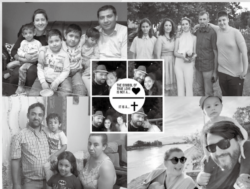
▲羅姆人傳道人關顧事需要你的支持

帖前 5:13 上說：「因他們所做的工，用愛心格外尊重他們。」如果你有感動，也能用愛心奉獻來幫助這些在疫情中，仍然堅守神托付的僕人，讓他能有更多時間去關心會友及傳揚福音，每位牧者傳道每年所需幫助約 4200 美元，希望你也能一起來幫助他們。✱