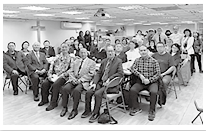
▲大台北同工聯禱會

1. 台北市更生團契〔更生人關懷/監獄佈道〕、2. 亞杜蘭關懷協會更生人生命造就、技能訓練〕、3. 台南市新扶小羊之家〔資助出獄更生人關懷/戒毒〕、4. 桃園十架電視台〔資助穆斯林&社區媒體宣教〕、5. 中宣佈道團隊〔協助原住民教會，成立敬拜/佈道團/教會復興〕、6. 西海岸鄉村校園宣道〔安排及培訓海外短宣隊〕、7. 嘉義以斯帖全人關懷協會〔疫情急難救助購口罩〕、8. 得勝者之家〔出獄更生人關懷、就業/